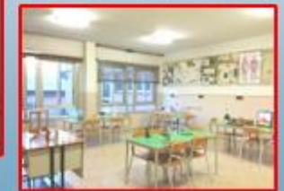
LABORATORIO DI SCIENZE

Per maggiori informazioni è possibile visitare il sito web dell'Istituto