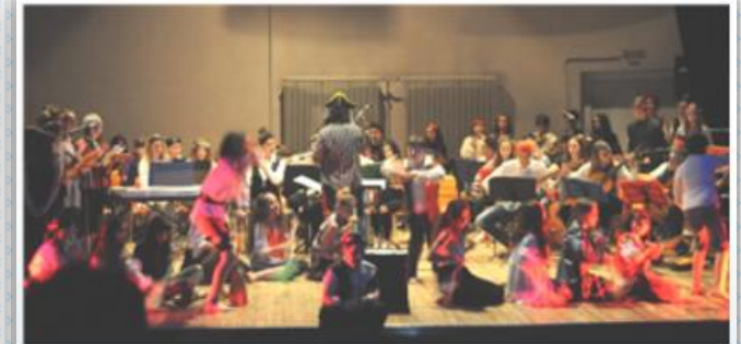
"Le avventure della Lama di Fuoco" Teatro Astra di Vicenza Spettacolo teatrale realizzato dagli studenti del musicale e dagli alunni del progetto PON.