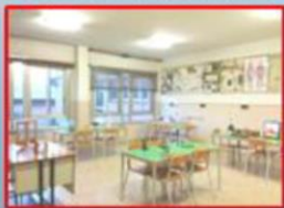
LABORATORIO DI SCIENZE