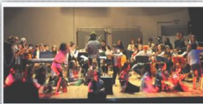
"Le avventure della Lama di Fuoco" Teatro Astra di Vicenza Spettacolo teatrale realizzato dagli studenti del musicale e dagli alunni del progetto PCN.

Gli alunni sono ammessi al corso dopo un test che verifica motivazione e attitudine, permettendo così di orientarli verso lo strumento più adatto.